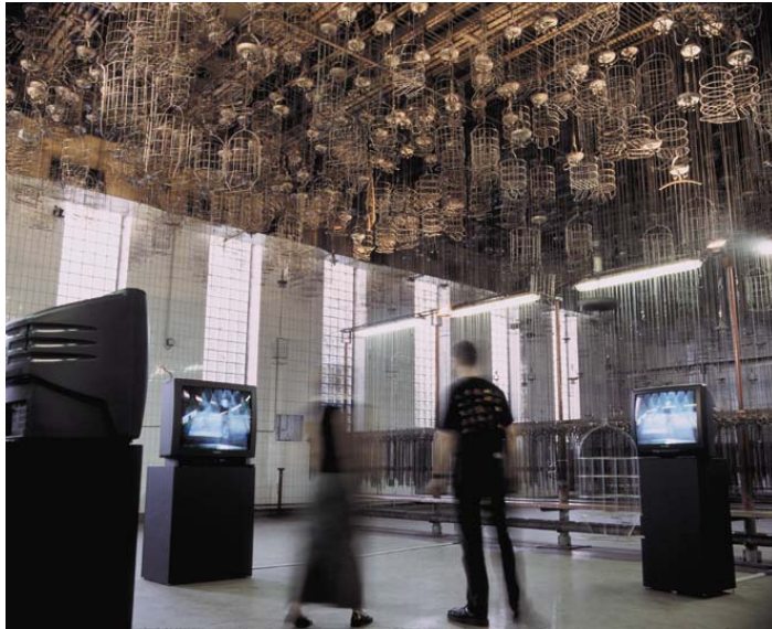
ABBILDUNG 3: A Body of Water: Aufnahme der Waschkäue

Die Wasser(lein)wand war in der Mitte des Duschraumes mit unterschiedlichen Bildfolgen auf beiden Seiten angeordnet. Das Publikum war so in der Lage, um sie herumzuwandern und zwei verschiedene Inhalte wahrzunehmen: Unabhängig voneinander schwebten die Szenarien im Wasserstrom ohne sich zu vermischen; zum einen das bunte interaktive Spiel der Besucher miteinander in Duisburg und Herten, zum anderen dokumentarische Szenen in schwarz-weiß von Bergarbeitern unter der Dusche bevor die Zeche stillgelegt wurde.